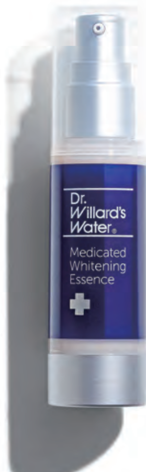
医薬部外品 薬用Dr.ウィラード・ ホワイトニングエッセンス 30mL 8,030円(税抜7,300円) 商品番号 E022

メラニン抑制と美白効果*1のある有効成分アルブチンを配合した薬用美白美容液。ウィラード・ウォーターの浸透力で、美白有効成分の力を肌のすみずみまで*2届け、肌本来の力を引き出します。