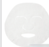
Dr.ウィラード・ うるおいチャージマスクVE 20mL×1枚 1,100円(税抜1,000円)