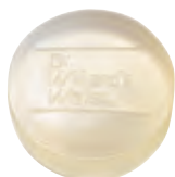
Dr.ウィラード・ フェイシャルソープ 90g 2,970円(税抜2,700円)