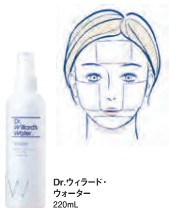
Dr.ウィラード・ウォーター 220mL

日焼けはやけどの一種です。痛みや赤みがある場合は、すぐに患部を冷やしてほてりを鎮めてください。